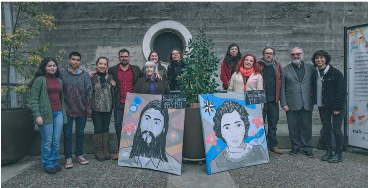
Comité Organizador y familiares